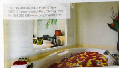
Ping Nakara Boutique Hotel & Spa 135/9 Chaoenprathet Rd., Chiang Mai Tel. 053 252 999 www.pingnakara.com

このホテルには宿泊客が快適に過ごせるように24時間ルームサービス、シャップ、エレベーター、コーセーショップ、バー/バブがあります。当ホテルではマッサージ、ジャグジー、スチームルーム、スパ、室外プール、ガーデンを含むスポーツ・レジャー施設を宿泊客に提供しています。便利なロケーションや行き届いたサービスに宿泊客は満足されるでしょう。